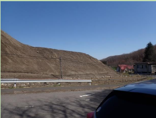
県外から搬入された大量の土砂 (民家の屋根を大きく上回る高さまで積み上げられた土砂)